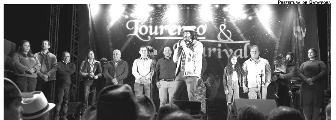
PREFEITURA DE BATAYPORÃ